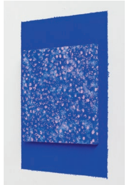
Bodil Nielsen | Uden Titel (Pink Stars), 2023 | Akryl på lærred og vægmaling | Lærred 23 x 23 cm | Vægfelt: 38 x 38 cm | Foto: Jan Søndergaard

er. Hos Nielsen kombineres det sfæriske med det materielle.