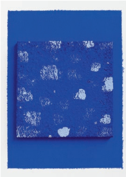
Bodil Nielsen | Uden Titel (Blue), 2023 | Akryl på lærred og vægmaling | Lærred 23 x 23 cm | Vægfelt: 38 x 38 cm | Foto: Jan Søndergaard