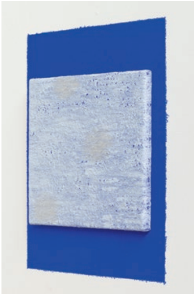
Bodil Nielsen | Uden Titel (Three Moons), 2023 | Akryl på lærred og vægmaling | Lærred 23 x 23 cm | Vægfelt: 38 x 38 cm