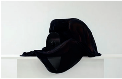
523 | Sophia Kalkau | Black Matter | 2012 | Lucia-print | 42×61 cm | Oplag: 400 | Signeret | Medlemspris: 2.500 kr.