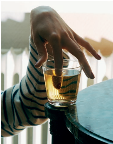
Torbjørn Rødland | Golden Lager | 2006 | 57 × 45 cm

til at tilgå billedet som billede. Rødland viser os, at DALL-E's billedmutationer er både kognitive og formalistiske: Kunstig intelligens har svært ved at tælle (fx hvor mange fingre, der bør være på en menneskehånd), og motorcyklen i billedets forgrund fremstår ikke længere som et lækkert designobjekt, men nærmere lidt utydelig og spøgelsesagtig. Alligevel skaber denne sære konstellation af elementer en scene, der ikke ligger langt fra et kunstfotografi – fx et kunstfotografi af Rødland. Hvis motorcyklen symboliserer frihed, og ørkenen symboliserer fraværet af det naturlige, kan scenen fortolkes som en metafor for digitalalderens langsomme billedrevolution: Ligesom hånden i ørkenen gemmer der sig et ukendt monster under fotografi-teknologiens overflade, og dette vil også ramme kunsten. Vi kender endnu ikke omfanget af dette monster, men en ting er sikkert: Der er meget mere, hvis man først begynder at grave.