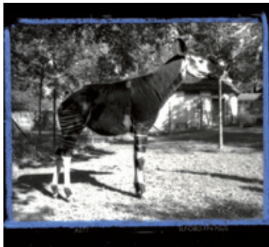
Gold-Toned Okapi / Test | 2006 | detail.

Fotografiet til Radeerforeningen er et klassisk sort/hvidt fotografi, hvor negativfilmen fremkaldes i mørke-