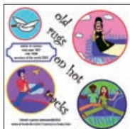
504 Lillibeth Cuenca Rasmus- sen: Old Rugs on Hot Tracks | 2002, Computeranimation – CD Rom | varighed 4 min. | Oplag 20 | Kr. 300 |