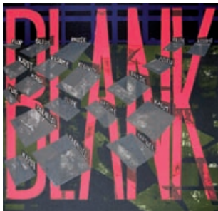
488 Jesper Christiansen: Blank | 1996 | Stentryk | 55,5 × 53 cm | Oplag: 400 | Kr. 600 |