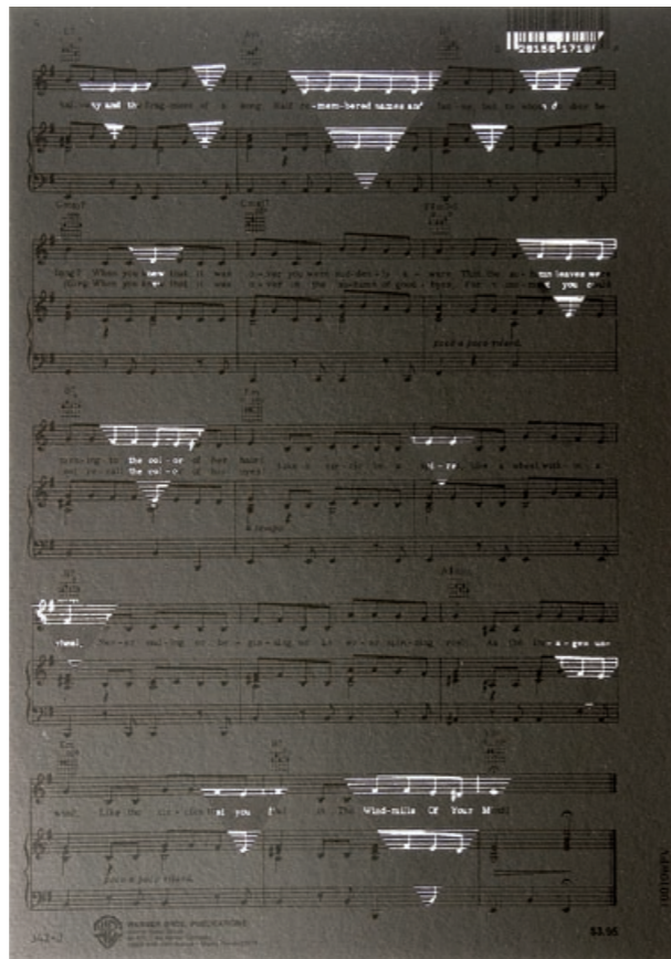
Composition for a frame #3 | 2007 | Silketryk | Papir: 29,7 × 21,7 cm | Oplag: 124 | Signeret, dateret og nummereret | Tryk: Axelle, Fine Arts, Ltd, Brooklyn, New York |

ker, vender rundt, tilsyneladende ledende efter indhold i sit privilegerede playboyliv. Musikken gør det samme og er komponeret som en næsten hypnotisk gentagelse af tilbagevendende temaer. Sangteksten beskriver ikke en bestemt tanke, men mere overordnet, hvordan tilsyneladende tilfældige tanker kan opstå og udvikles i forgreninger af associative forløb – ideer der dukker op igen i nye former, indre billeder der fører til atter andre, halvt glemte drømme der giver ny mening og sammenhænge der pludselig forekommer logiske. Teksten beskriver den associative metode, som synes at være udgangspunktet for Simon Dybbroe Møllers eget arbejde og den måde som hans