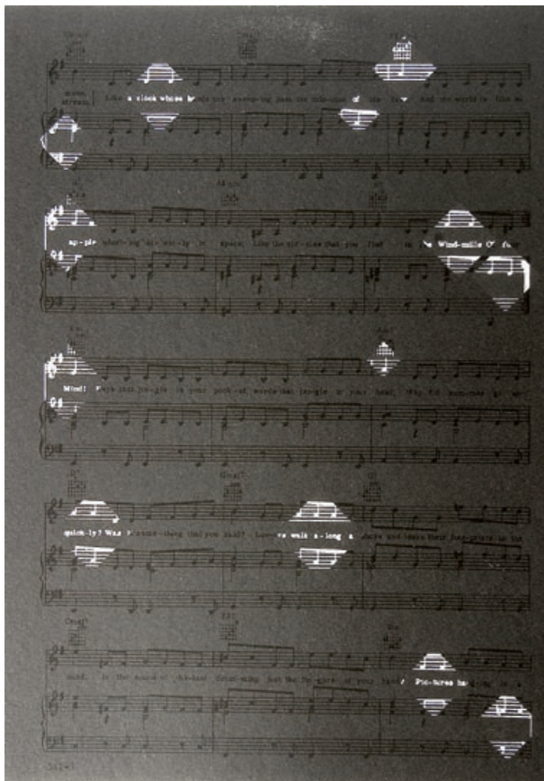
Composition for a frame #2 | 2007 | Silketryk | Papir: 29,7 × 21,7 cm | Oplag: 124 | Signeret, dateret og nummereret | Tryk: Axelle, Fine Arts, Ltd, Brooklyn, New York |