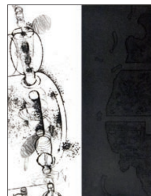
462 Thomas Bang: Dykker | 1989 | Radering | 29,7 × 23 cm | Oplag: 20 | Kr. 1.000 |