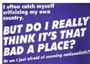
509 Lise Harlev: My own Country | 2005 | 2 litografiske plakater | 59,4 × 84 cm | Oplag: 300 | Kr. 400 |