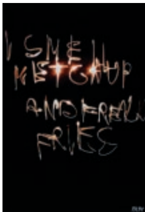
Peter Bonde Offset tryk, 100 × 67,5 cm.