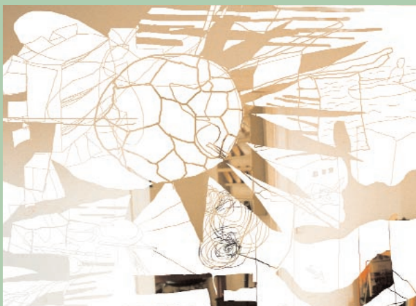
Kasper Bonnén / Uden titel 2002 Digitalt inkjetprint, unika, 60 × 82 cm, signeret Pris: 5.000 kr.