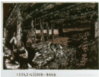
Kehnet Nielsen Linoleumsnit, 51,5 × 72 cm.