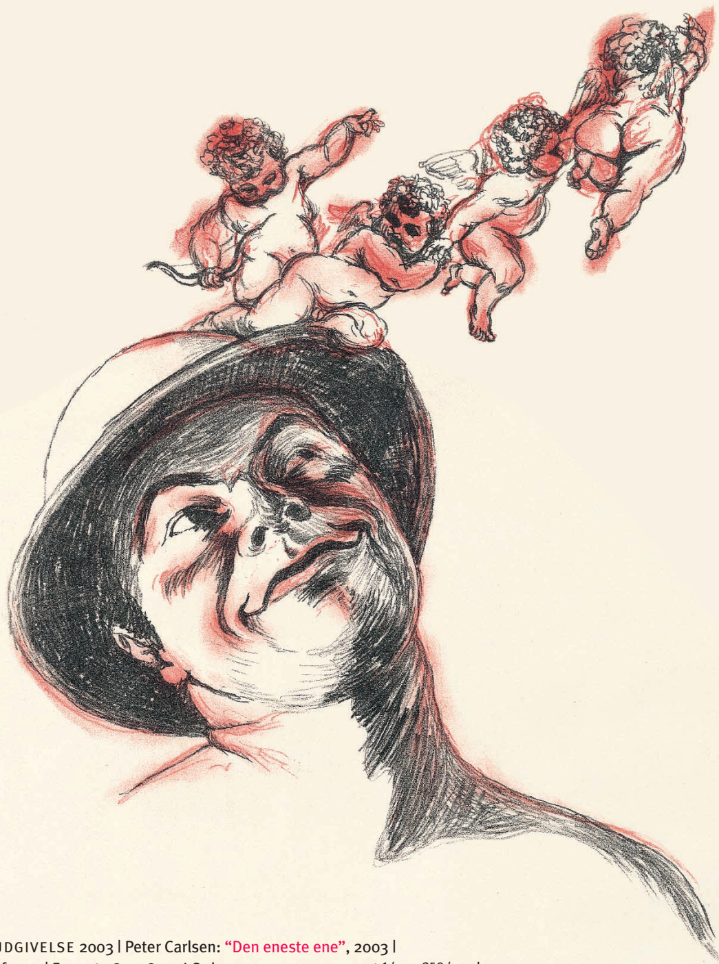
MEDLEMSUDGIVELSE 2003 | Peter Carlsen: "Den eneste ene", 2003 | Litografi i 2 farver | Format 48 × 38 cm | Oplag: 250 ex. nummereret 1/250-250/250 | Signeret og dateret | Trykkeri: Færøernes Grafiske Værksted, Thorshavn |