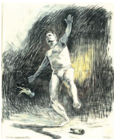
Tizian døddrukken, 1993 (kul og kridt på papir, 300 × 250 cm).

De billedmættede omgivelser med alt fra de mest trivielle fidusbilleder og reklamer til de kanoniserede mesterværker fra verdenskunsten leverer kulisser til iscenesættelsen af den slags genrebilleder, som er blevet mit billedkunstneriske virkefelt. Selviscenesættelsen er et af de mest brugte greb i mine arbejder. Noget jeg har til fælles med en lang række kunstnere, der hver især bruger selvfrestillingen vidt forskelligt. Allerede inden jeg havde nogen anelse om, at det var der, mit arbejdsfelt skulle ligge, var min interesse for og beundring af J.F. Willumsen stor.