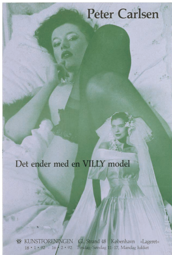
Det ender med en VILLY model (plakat).