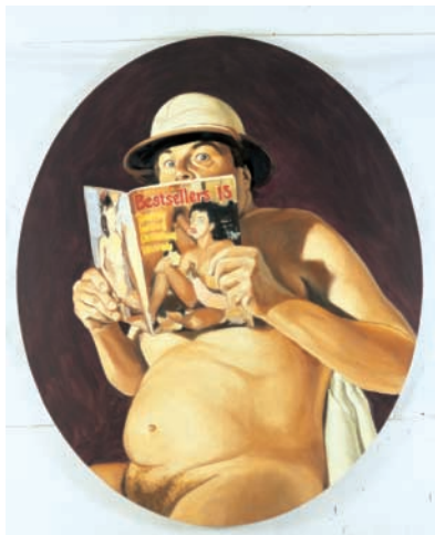
Fra serien Villy i vælten : I sansernes vold (ovalt maleri).

Og selvom det ikke altid ender eller begynder med en Lillymodel, så lever drømmen om den eneste ene i bedste velgående. For Den eneste ene er drømmen om den perfekte partner, som man kan leve lykkeligt og lidenskabeligt sammen med hele resten af livet.