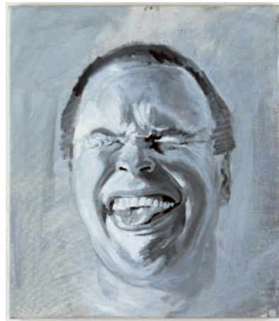
I ONLY PAINT WHAT I FEEL nr. 19 (Maleri).

I tegningen Tizian døddrukken fra 1993 mimer jeg Willumsens selviscenesættelse. Willumsens Tizian, der er døende, er ved at falde bagover ned i det sorte dyb, men hvor hans maleri overbevist