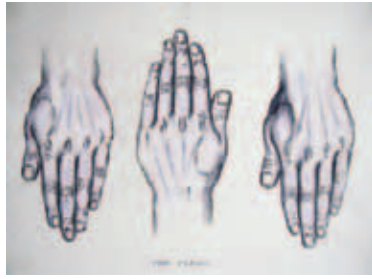
475 | Peter Neuch | Rebus | 1993 | Blyant, akryl, tusch, blæk, rødvin og akvarel | 50 × 70 cm | Kr. 1200 |