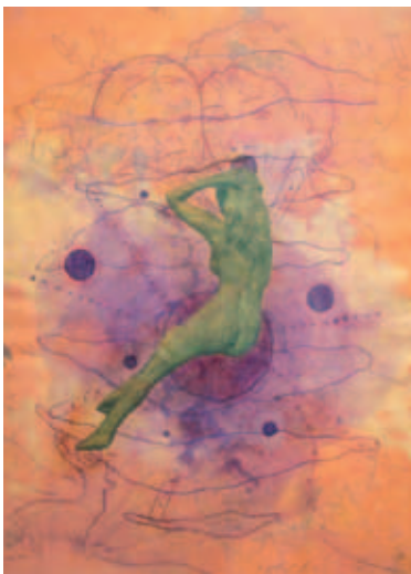
476 | Kaj Nyborg | Uden titel | 1991-93 | Tusch, akvarel og blyant | 40 × 30 cm | Kr. 1000 |