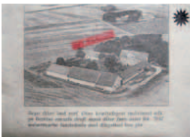
486 | Jørgen Michaelsen | Bør Ud- drages | 1995 | Fotokopi, stemplet og lamineret | 21 × 29,7 cm | Kr. 800 |