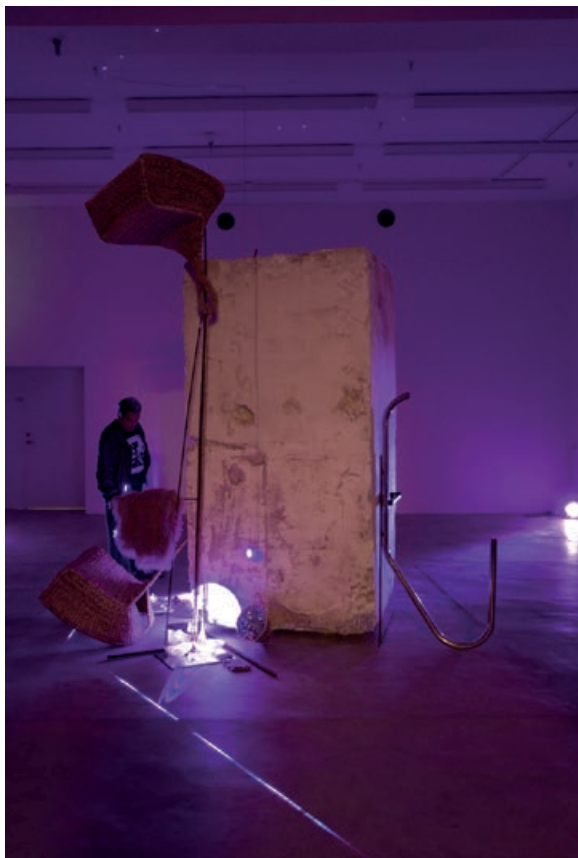
Martin Erik Andersen | Nut – The Nightsky and The Astralpool (the Obelisk, the Guillotine) | 2015

idet de indtræder i fragmentariske og skrøbeligt konstellationer, der balancerer på kanten af vores forståelseshorisont.