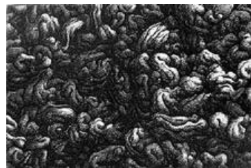
466 | Michael Kvium | Tankemodel | 1990 | Radering | 14 × 20,9 cm | Papirmål: 32 × 38 cm | Oplag: 425 | 1.500 kr

Vi tilbyder i dette Medlems-nyt muligheden for at erhverve resteksemplarer af 6 tidligere medlemsudsendelser fra foreningens arkiv. Vi gør opmærksom på at der kun resterer få eksemplarer af de tilbudte værker, der alle er signeret af kunstneren.