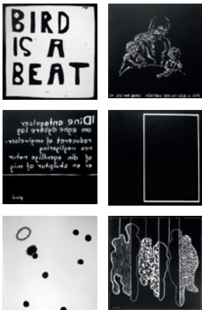
522 | Svend-Allan Sørensen: Bird is a beat | Gudrun Hasle: Uden titel (Da jeg var barn fårtrak jeg at leje a lene) | Pind: Dine antagelser om egne dybere lag reduceret af omgivelsernes negligering af din egentlige natur er en skulptur af mig | Lene Adler Petersen: Israels Plads | Henriette Heise: Lens flare | Pernille Kapper Williams: Extraction of form (shape by shape) | 6 linoleumssnit udført i 2011 | Hver 20,4×20,4 cm | Oplag: 420 | Kr. 1.000

publikum. Hver udgivelse ledsages af bladet Medlemsnyt hvori vi informerer om udgivelserne, kunstnerne bagved, og om foreningens virke i øvrigt. Foreningen arrangerer – ved særlige lejligheder – udstillinger med egne udgivelser.